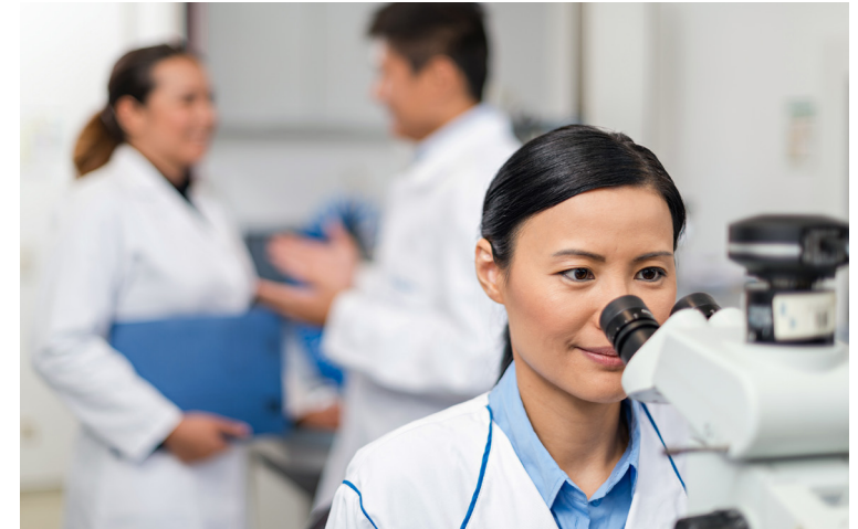
Bei (Bio)Pharma zielen wir darauf ab, unsere Fähigkeiten für spezialisierte Pharma- und Ernährungsprodukte skaliert zu nutzen.

Auf diesen drei Plattformen werden wir Therapien von Weltklasse anbieten und wollen damit einen maßgeblichen Beitrag leisten, die Versorgung und Behandlungsergebnisse von Patientinnen und Patienten zu verbessern.