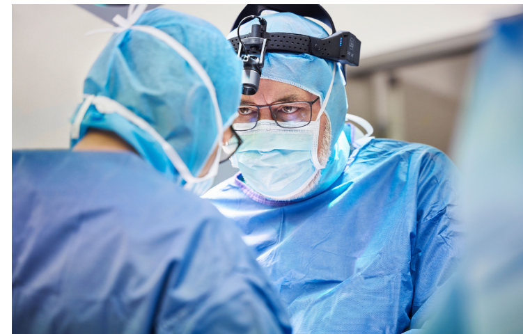
Fresenius hat eine Schlüsselposition im Herzen der Gesundheitsversorgung.

Im Februar dieses Jahres haben wir dann entscheidende Weichenstellungen für einen erfolgreichen Neustart vorgenommen. Sie geben Fresenius wieder Richtung und ermöglichen es, nachhaltig Wert zu schaffen – für unsere Patientinnen und Patienten, Kundinnen und Kunden, Mitarbeiterinnen und Mitarbeiter und natürlich für Sie als Eigentümerinnen und Eigentümer.