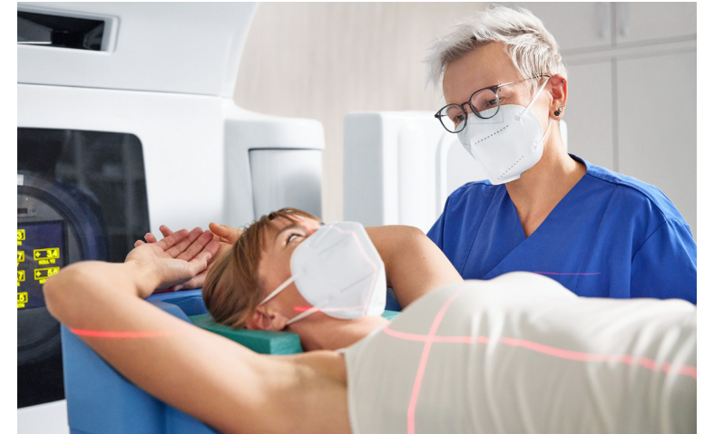
Im Jahr 2022 haben wir mehr als 24 Millionen Patientinnen und Patienten in unseren Krankenhäusern behandelt.

Wenn wir über die Zukunft unseres Unternehmens sprechen, über #FutureFresenius, dann werden drei Dinge unser Denken und Handeln leiten: eine einfachere Konzernstruktur , eine verbesserte Performance und ein klarer Fokus . Daher unterscheiden wir künftig bei unseren vier Unternehmensbereichen zwischen Operating Companies und Investment Companies. Unsere Operating Companies sind Fresenius Kabi und Fresenius